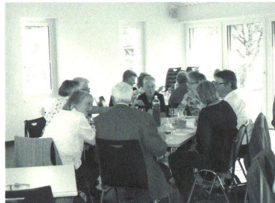
gemütliches Zusammensein beim anschliessenden Mittagessen

göttlichen Zusage gesprochen. Er möge alle an jedem neuen Tag begleiten, in all seinen Freuden und Lasten. Mit einer Rose, - überbracht von den jetzigen Konfirmandinnen - und dem aktuellen Klassenfoto, zogen wir aus der Kirche und wechselten ins Kirchgemeindehaus zum freudigen und intensiven Austausch mit alt Vertrauten und Einigen die von auswärts gekommen sind.