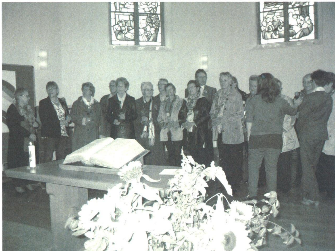
jetzige Konfirmanden überreichen den vor 50 Jahren konfirmierten eine Rose